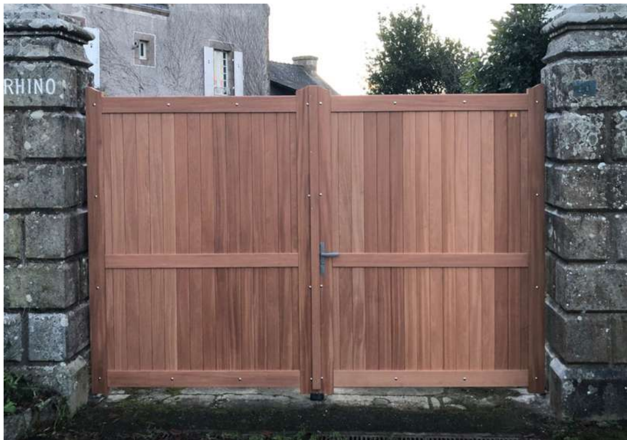
Portail Argonne en Sipo

PORTAILS ET CLÔTURES EN BOIS PAR JOUEN FRÈRES