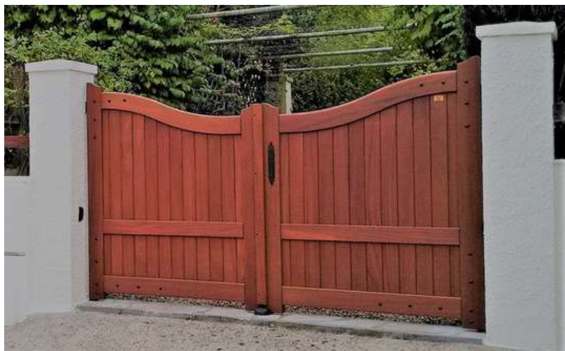
Portail Argonne en Sipo - CDGI - Motorisé