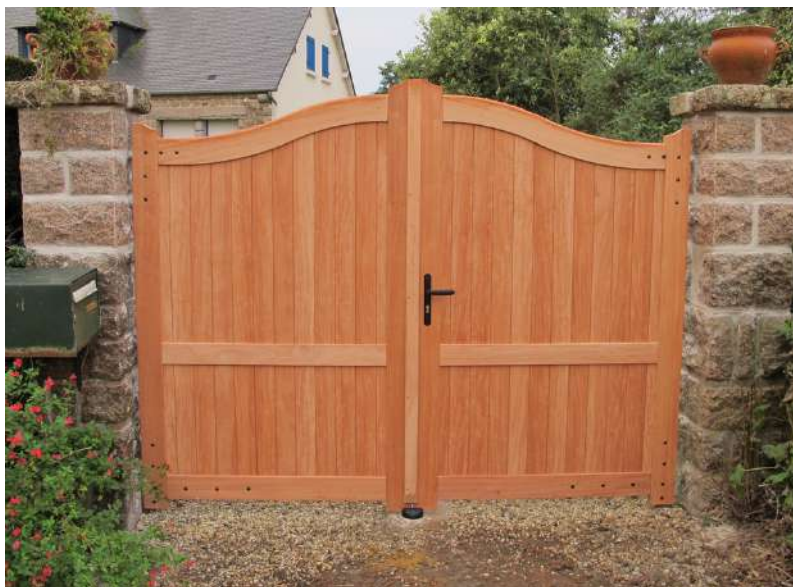
Portail Argonne en Sipo - CDG